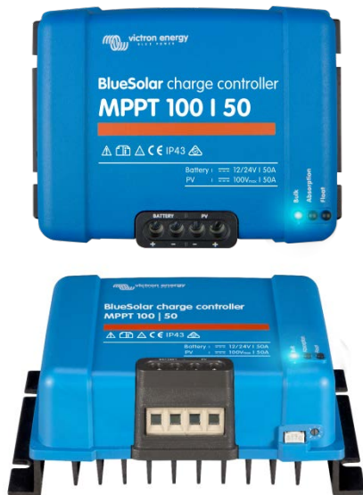
Contrôleur de charge solaire MPPT 100/50